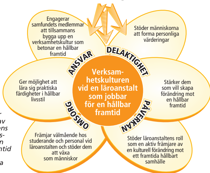
Bild 1: Faktorer för skapandet av läroanstaltens verksamhetskultur för en hållbar framtid (OKKA-stiftelsen, Erkka Laininen).