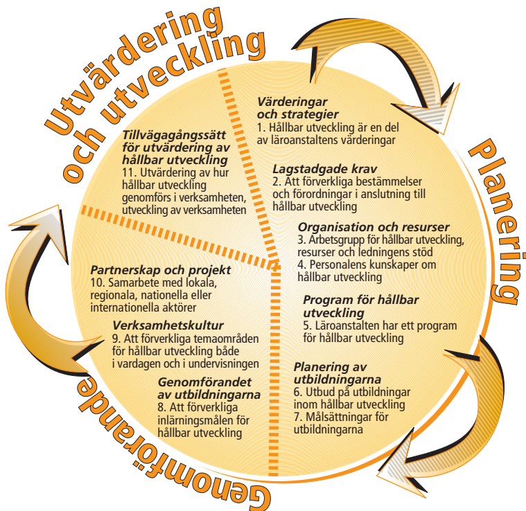
Bild 2: Struktur och centralt innehåll av kriterier för hållbar utveckling i fria bildningen.

Faserna i hjulet består av planera, genomföra, utvärdera och utveckla (bild 2). På grund av detta är det lätt att implementera kriterierna i läroanstaltens eller utbildningsarrangörens kvalitetsystem, exempelvis i utvärderingskriteriet CAF som används inom den fria bildningen.